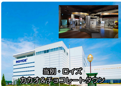
当別・ロイズ カカオ&チョコレートタウン