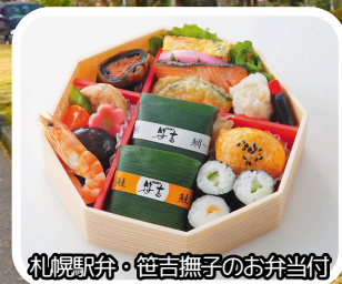
札幌駅弁・笹吉撫子のお弁当当付

北海道の厚田の厳しい冬を乗り越えて、戸田墓園には毎年8000本の桜が満開に咲き薫ります。冬から春へと移りゆく、季節の優しい息づかいを感じながら、園内に育つ美しい桜をご堪能ください。