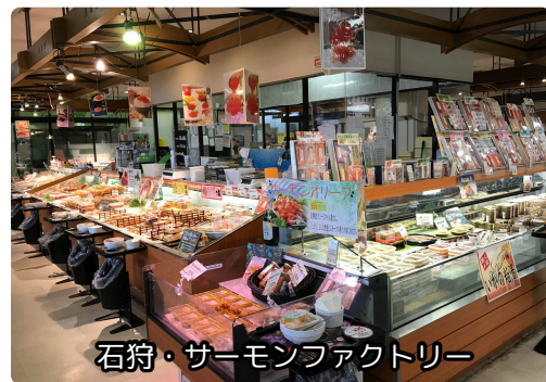
石狩・サーモンファクトリー