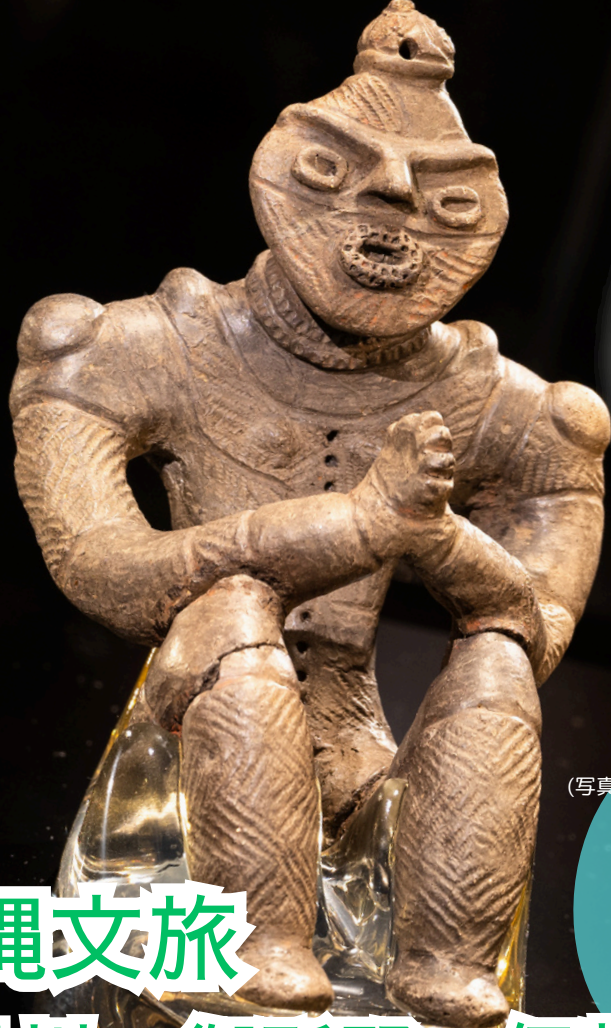
合掌土偶

苫小牧港発着 シルバーフェリー利用 世界文化遺産の縄文遺跡群を 案内付きで見学。