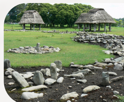
大湯ストーンサークル