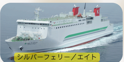
シルバーフェリー/エイト