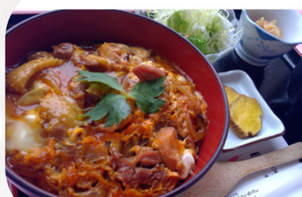
3日目/比内比内地鶏の親子丼