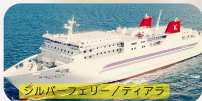
シルバーフェリー/ティアラ