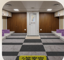
2等客室 (毛布は有料貸出)