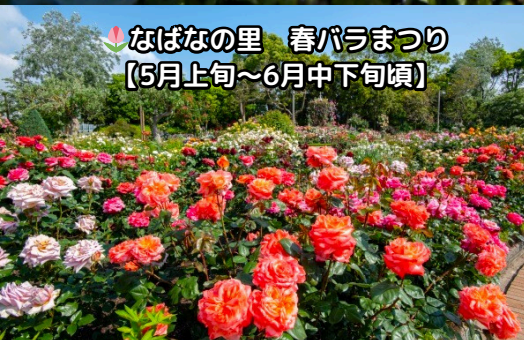
なばなの里 春バラまつり 【5月上旬～6月中下旬頃】

三重県桑名市・なばなの里 ネモフィラまつり【4月中旬～5月中旬頃】 四季折々の美しい花々が咲き誇る、日本最大級の花のテーマパーク「なばなの里」。四季を通じて様々な花々や木々を鑑賞できます。ネモフィラは北米原産のムラサキ科の1年草で、直径3センチほどの花と唐草模様のような形の葉が特徴です。ちょうどゴールデンウィーク頃になるとネモフィラの可憐な青い花が一面を埋め尽くし、青空とつながるような絨毯の上を歩くことができます。