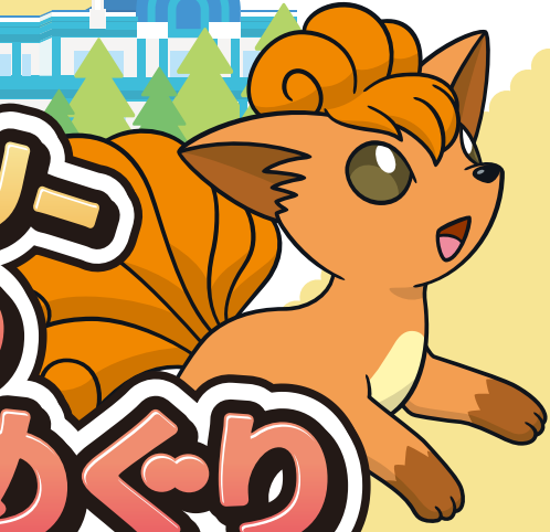
北海道だいじき発見隊 ロコン