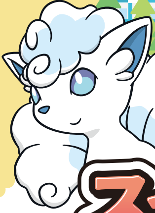
北海道だいじき発見隊 アローラロコン