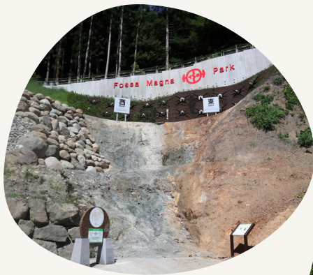
糸魚川ユネスコ世界ジオパーク