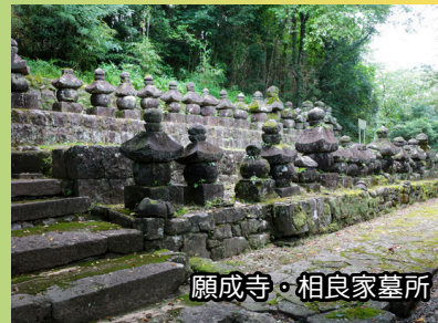
願成寺・相良家墓所