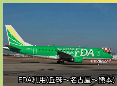
FDA利用(丘珠～名古屋～熊本)