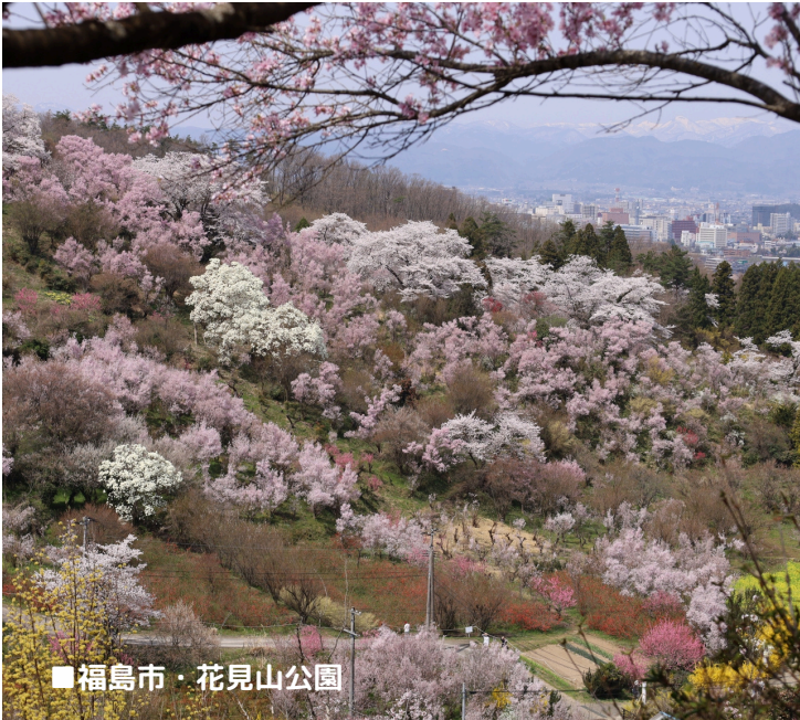
■福島市・花見山公園