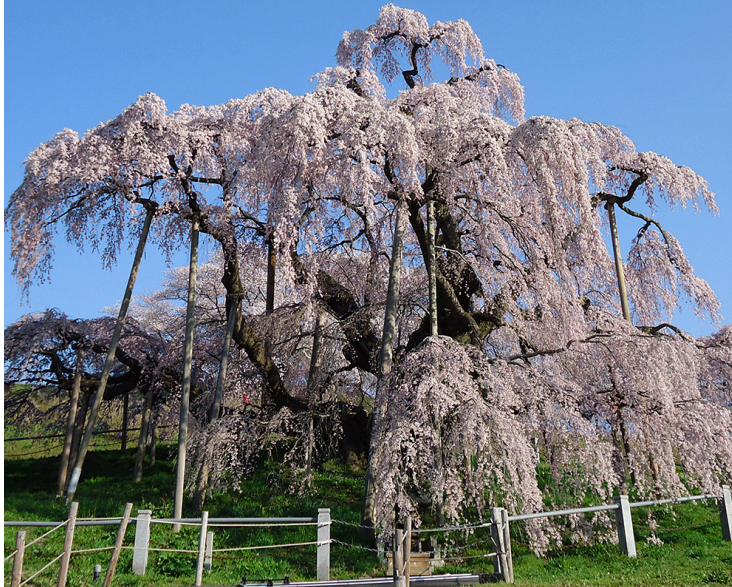
■三春町・三春滝桜（日本三大桜・国天然記念物）