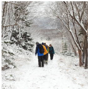
森の散策イメージ