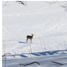
野生動物にも出会えるかも