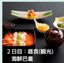
2日目:昼食(観光) 海鮮弁当