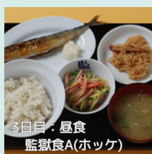
3日目:昼食 監獄食A(ホッケ)