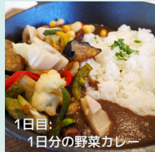
1日目: 1日分の野菜カレー