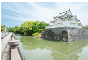
駿府城公園・駿府城跡