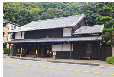
岡部宿・大旅籠柏屋